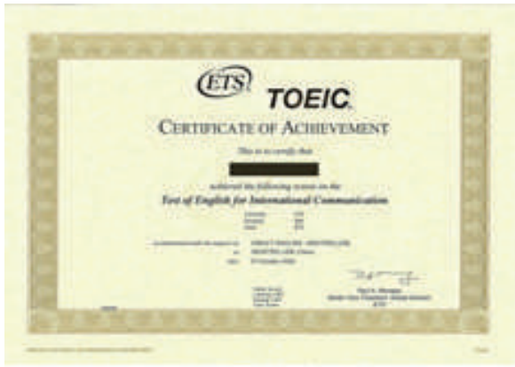
CERTIFICACIÓN OFICIAL DE IDIOMAS TOIEC No conduce a la obtención de un título con validez oficial

No conduce a la obtención de un título con validez oficial