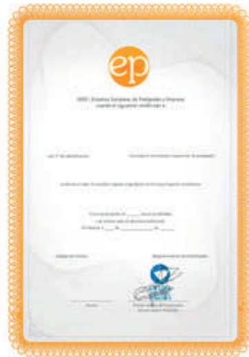
PROFESIONAL CERTIFICATE - EP Certificado profesional con reconocimiento internacional por EP - Estudios Europeos de Postgrado