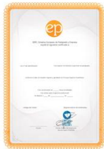
PROFESIONAL CERTIFICATE - EP Certificado profesional con reconocimiento internacional por EP - Estudios Europeos de Postgrado