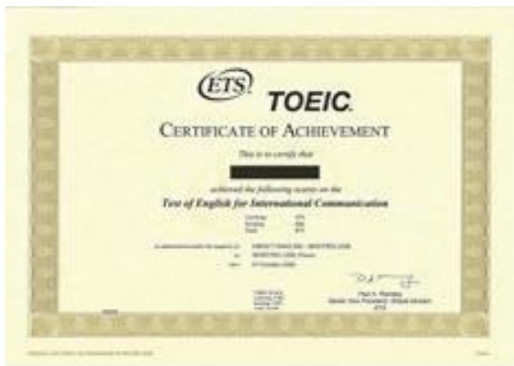
CERTIFICACIÓN OFICIAL DE IDIOMAS TOEIC No conduce a la obtención de un título con validez oficial

No conduce a la obtención de un título con validez oficial